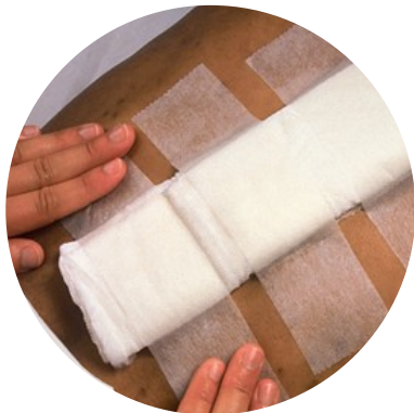
Feste av bandasje og tube