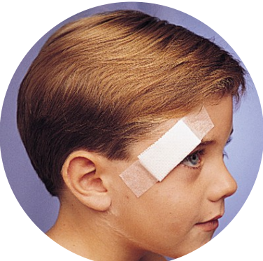
Feste av bandasje