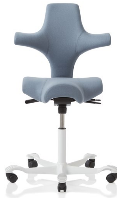
Design: Peter Opsvik. Patent- og designbeskyttet